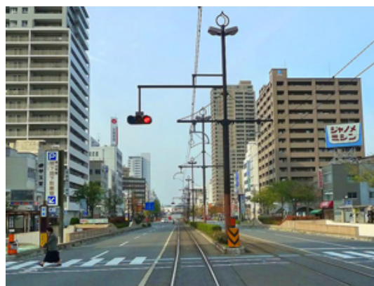
路面電車が走る桃太郎大通り

4～5月は、本当においしい瀬戸内の魚が水揚げされる季節。気候も良く、路面電車で向かう人のほか、岡山駅から15分ほど歩くだけでのれんを見つけることができます。いつもは乗り継ぎで降りたことがないという忙しいビジネスパーソンも、ぜひ気分を変えて立ち寄ってみてください。素通りしてしまうには惜しいほどの美味に舌鼓を打つことができるでしょう。