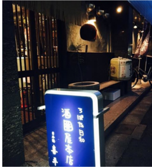
青い立て看板と杉玉が目印の「酒屋本店」

店の正面は、城下町によく見られる間口の狭い造り。店内へ一歩踏み入ると、奥までずーっと延びる通路の両側に、カウンター席とテーブル席が並びます。カウンター席には板場の職人が、さまざまな魚を次々とさばく手際の良さを見ることができる席もあります。