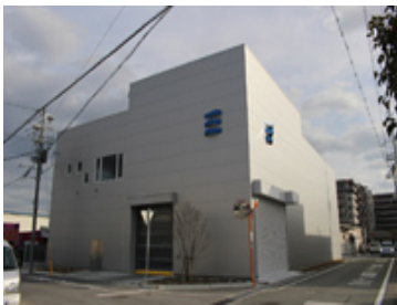
< 有限会社三裕工業 >

スチール・アルミニウム・ステンレスなどの精密板金加工、各種レーザー加工、溶接を中心に事業を展開。制御箱からブラケット、本棚、建築補強まで「わがまを相談できる」企業として、発注者の多様なオーダーに対応する。納品前の検査のほか、工程ごとに寸法や重要箇所の徹底した確認を行うなど、全従業員が「いいモノを作る」というスタンスを貫いている。2011年設立、本社を兵庫県川西市に置く。