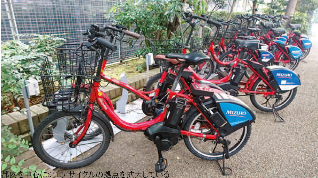
都内を中心にシェアサイクルの拠点を拡大している

中国でモバイクと争うオッフオも日本進出の準備を進めている。ソフトバンクコマース&サービスと手を組み、今秋にも東京と大阪でサービスを開始する予定である。