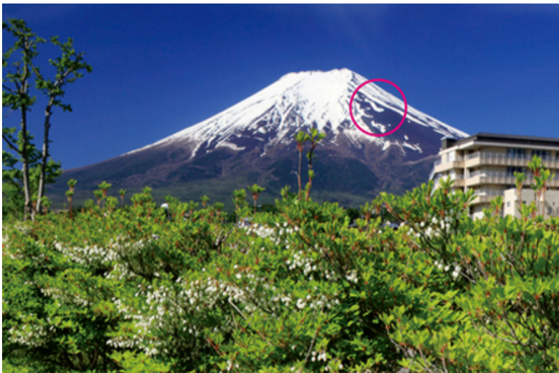
富士山の「農鳥」。小鳥が左を向いている。時期によって形が変わるのが面白い

また、山名にはなっていませんが、身近なところでは富士山の農鳥もよく知られています。4月下旬～5月下旬、富士吉田から見た富士山の八合目付近に現れます。初期は羽をなびかせた鳳凰のようで、時期が進むとヒヨコのようなかわいらしい形になります。