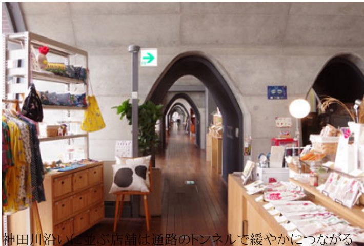
神田川沿いに並ぶ店舗は通路のトンネルで緩やかにつながる