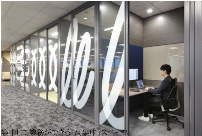
集中して業務ができる「高集中」スペース

また、そこまで集中しなくても構わないけれども自分1人で仕事を進めたいというときもあります。多少、話し掛けられても構わないけど、緩やかに集中したいというケースです。そういうときに使うのが「コワーク(Low-Focus)」のスペースです。