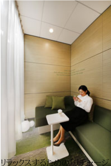
リラックスするための「リチャージ」スペース

これら以外にも、3人以上のグループでアイデアを出し合うための「アイデア出し(CREATE)」というスペース、リフレッシュするための「リチャージ(RELAX)」というスペースなど、使い方ごとに最適な10の空間がこのオフィスにはあります。