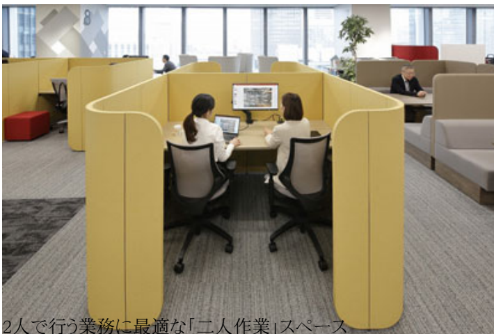
2人で行う業務に最適な「二人作業」スペース

さらに、2人並んで一緒に画面を見ながら進めると生産性が高まるような仕事もあります。今までのオフィスでは自席に呼んで2人並ぶという少し落ち着かない形にするか、大きな会議室に2人でこもるといったもったいないスペースの使い方になっていたと思います。このオフィスでは、2人の作業にぴったりの空間として「二人作業(DUO)」というスペースを設けました。