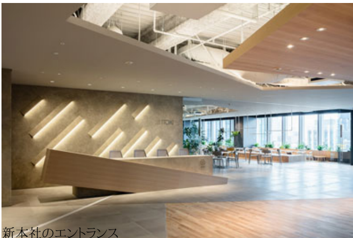
新本社のエントランス

私は、自分の頭で考え行動する人材をいかに輩出するかが、現在すべての日本企業の大きなテーマになっていると思います。我々がこのオフィスで何をやっているかという、「1人ひとりが自分の働き方を自分で考えてデザインし、個々の能力を最大化する働き方」への挑戦です。