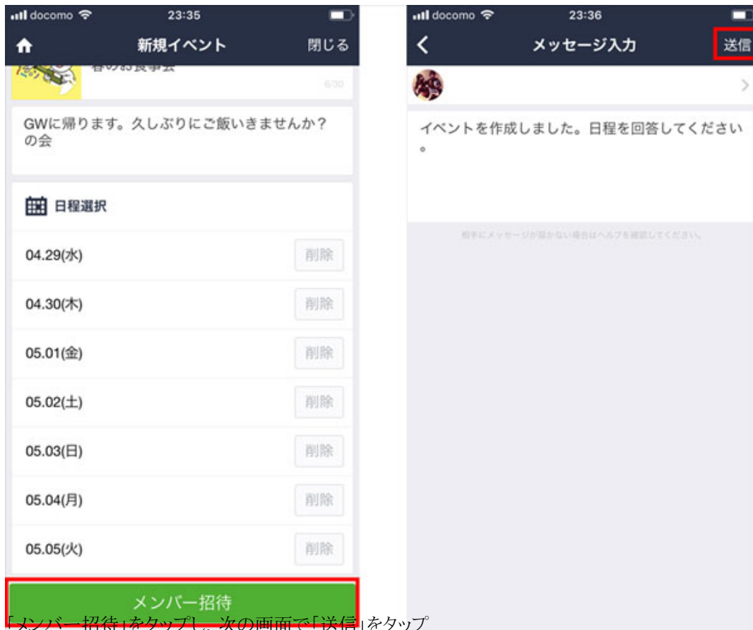
「メンバー招待」をタップし、次の画面で「送信」をタップ