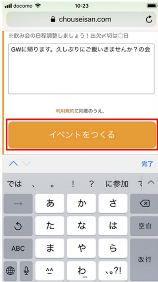
イベント名や概要を入力し、「イベントをつくる」をタップ