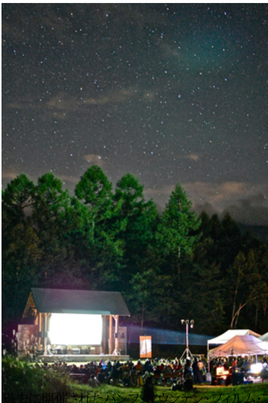
日本で開催されたバンフ・コンテン・フィルム・フェスティバルin Japan(乗鞍)の様子

この夏は新型コロナウイルスや遅かった梅雨明けの影響で、思うように山へ行けなかった人がほとんどでしょう。日本だけではなく、世界中の人々が我慢を強いられています。しかし、がっかりすることばかりではないようです。毎年、世界のアウトドアファンを熱狂させているフィルムフェスが、今年はオンラインで開催されることになりました。家にいながら最新のアウトドア映画を楽しめるチャンスかもしれません。