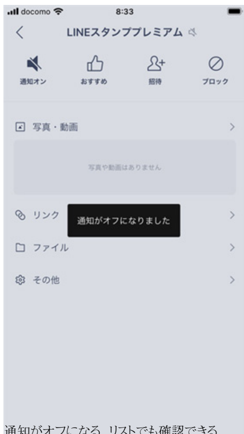
通知がオフになる。リストでも確認できる