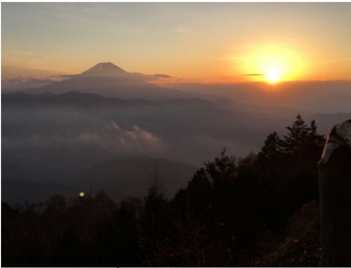
からの日の出でした

、ほぼ山頂の真上に来ました。シルエットで浮かび上がった富士山から差し込む朝の光はとても爽やかで、私の心も温かく包まれました。それにしてもお彼岸の中日、真東から日が昇る秋分の日にダイヤモンド富士が見られるなんて、七面山はすごい所だと思いませんか？