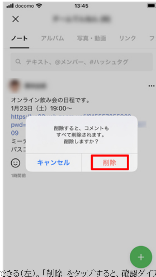
「投稿を修正」をタップすると、投稿した内容を編集できる(左)。「削除」をタップすると、確認ダイアログが表示される(右)