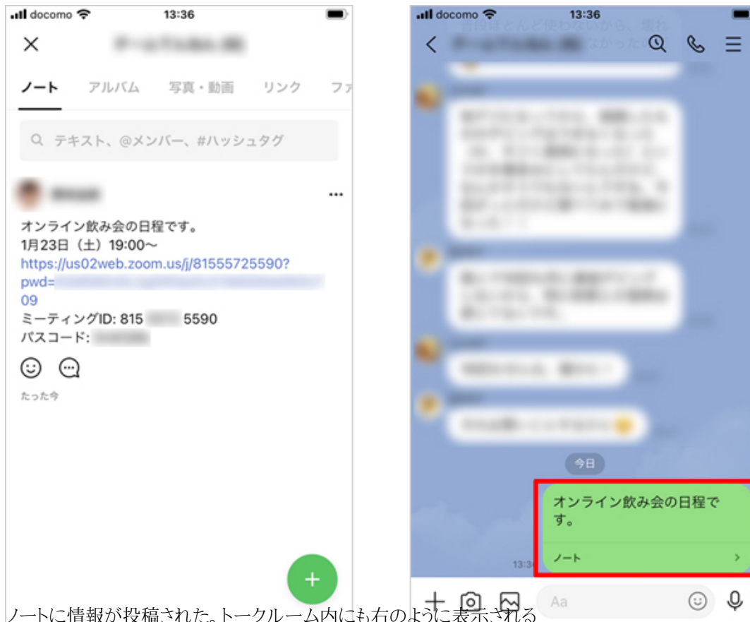
ノートに情報が投稿された。トークルーム内にも右のように表示される

トークルームにコメントがどんどん追加されて情報が見つけにくくなっても、ノートに投稿しておけばそこから確認できる。自分が投稿したノートは修正や削除も可能だ。