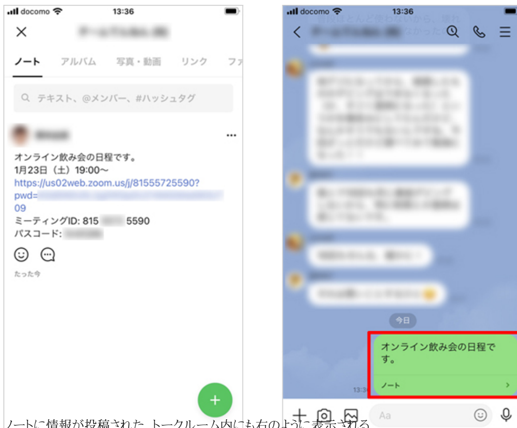
ノートに情報が投稿された。トークルーム内にも右のように表示される

トークルームにコメントがどんどん追加されて情報が見つけにくくなっても、ノートに投稿しておけばそこから確認できる。自分が投稿したノートは修正や削除も可能だ。