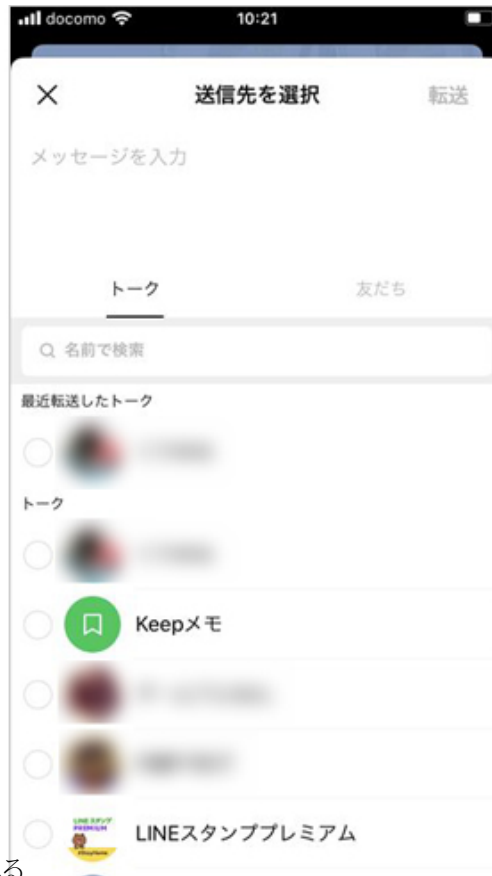
「もっと見る」をタップすると、全員のリストが表示される