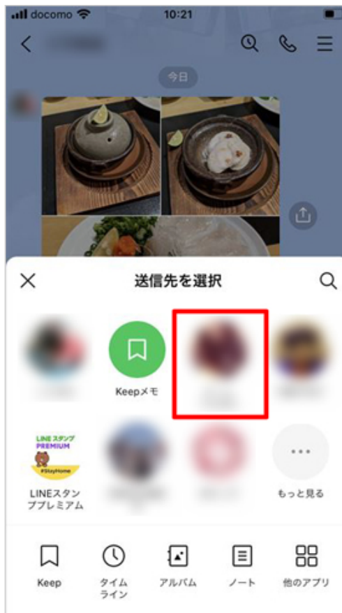
写真横のアイコンをタップし、送信先を選択する