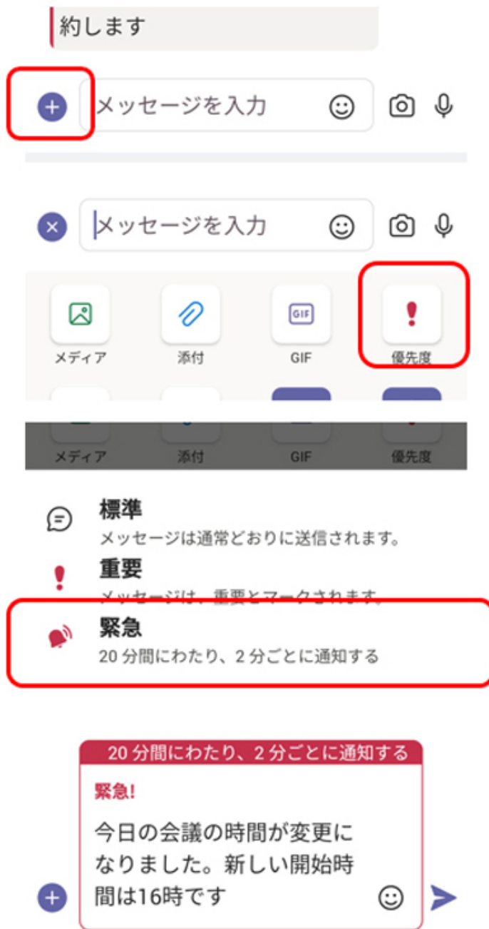
▲スマホから優先度を指定するときは、入力欄左の「+」を選び「優先度」をタップ。今回は「緊急」を選んでみた