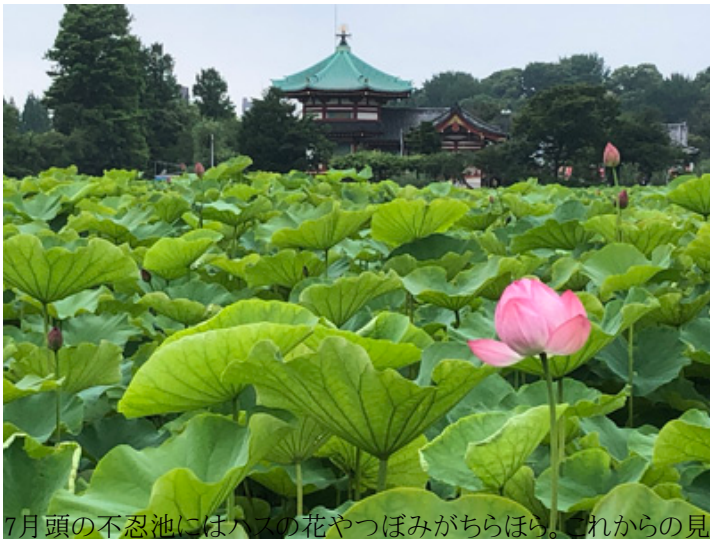
7月頭の不忍池にはハスの花やつぼみがちらほら。これからの見ごろが楽しみ

でも食べられますが、この時期はあらかじめ、不忍池が見渡せる席を電話で予約しておきましょう。もし数人で訪れるなら、別料金で利用できる個室が安心です。目の前に広がる不忍池は、青々としたハスの葉と桃色に咲くハスの花のまぶしさで、写真愛好家も納得の美しさです。風景に見とれていると、外の暑さを忘れてしまうほどすがすがしい気分になりました。