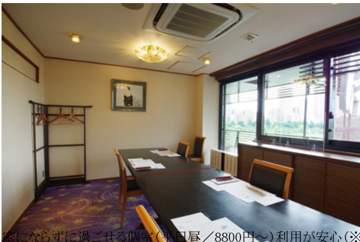
客にならずに過ごせる個室(平日昼/8800円〜)利用が安心(※要予約。夜はコース利用のみ)