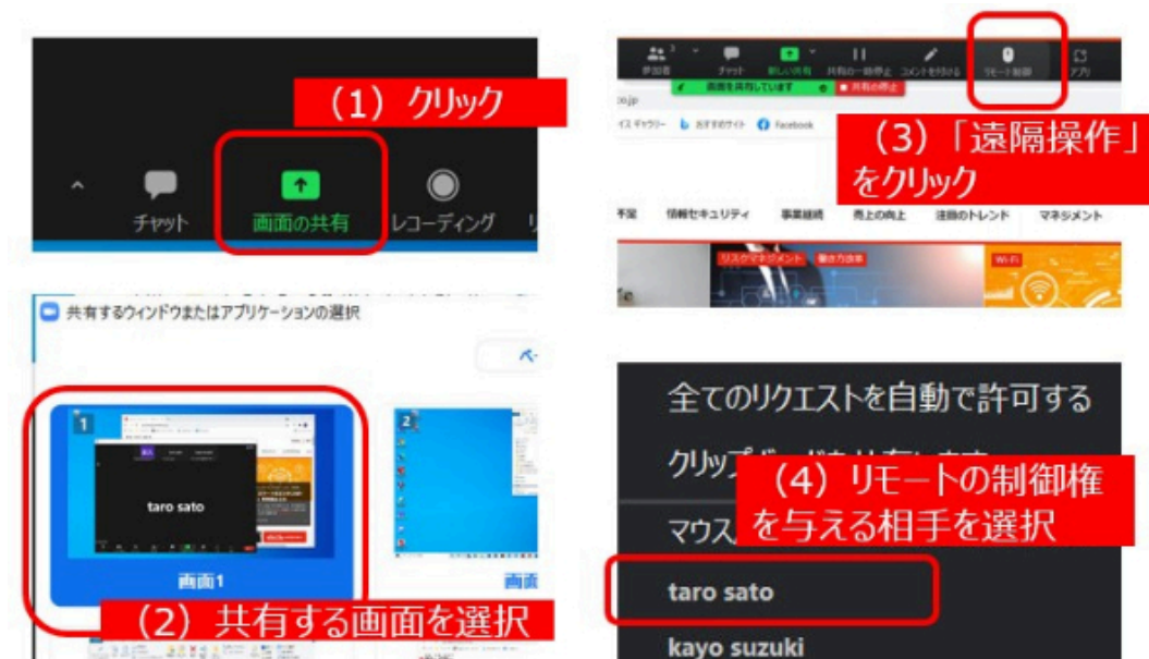
▲画面を共有したら、共有した側から「遠隔操作」のボタンで、リモートの制御権を与える相手を選ぶ

Zoomで自分が相手の画面を操作するには、「リモートコントロール」の機能を使います。といっても、単体でリモートコントロールの機能があるのではなく、「画面の共有」の機能の中に組み込まれているので、これまで存在に気付かなかった方もいるかもしれません。早速リモートコントロールの使い方を見ていきましょう。