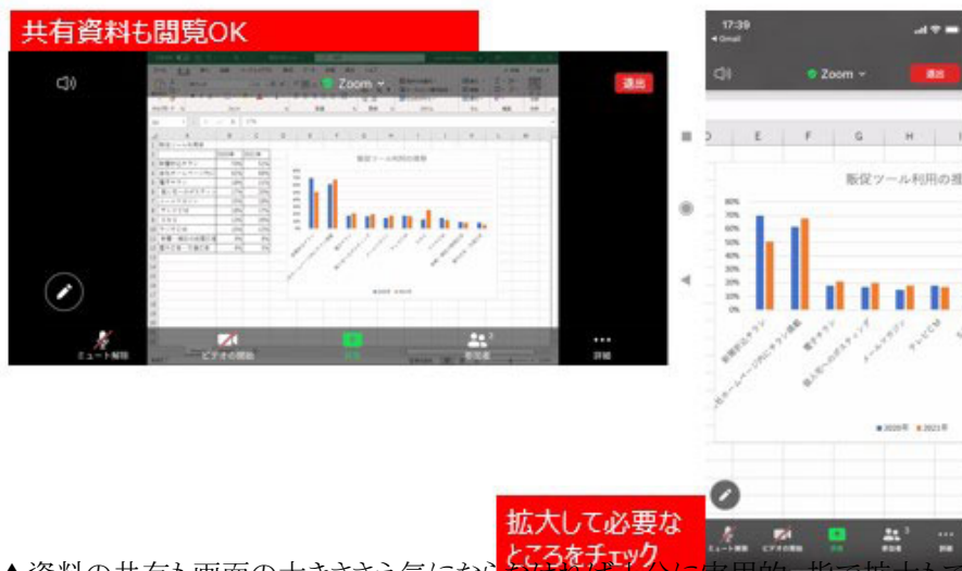
▲資料の共有も画面の大ききさえ気にならなければ十分に実用的。指で拡大もできるので、視認性は確保できる

相談者さんが気にしていた、共有資料の表示はどうでしょう。ホスト側から共有された資料を表示してみましたが、横向きの画面表示にすればパソコンと同様に閲覧できました。縦位置の画面表示で横長の資料を共有すると、文字が小さくなってしまいます。でもそこはスマホですから、二本指で広げるように操作すれば簡単に拡大できます。お使いのスマホの画面のサイズにもよりますが、よほど小さな文字などの資料の共有でなければ、スマホでも十分に内容を確認できそうです。自分から画面や資料を共有することも可能です。DropboxやGoogleドライブ、OneDriveといったストレージの共有にも対応しています。