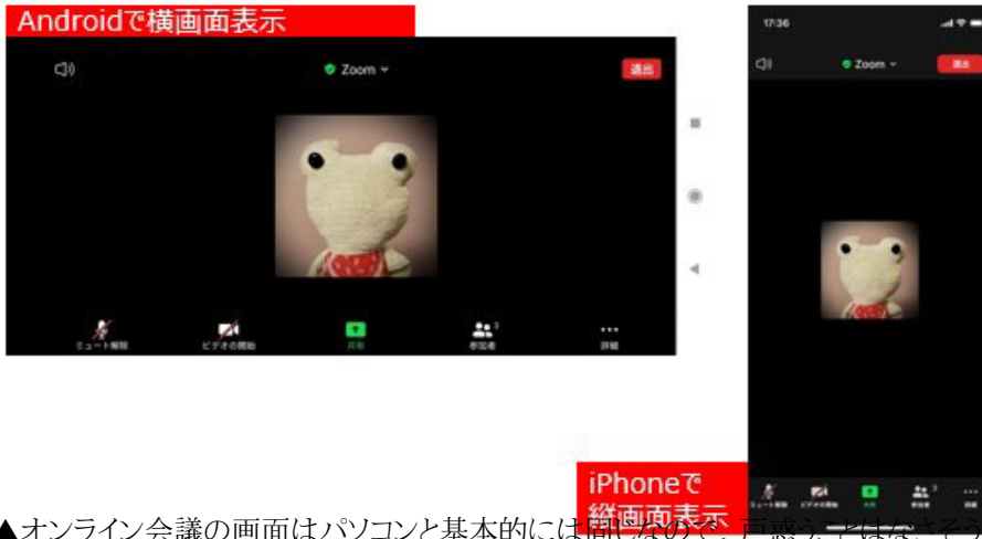
▲オンライン会議の画面はパソコンと基本的には同じなので、戸惑うことはなさそう

相談者さんが気にしていた、共有資料の表示はどうでしょう。ホスト側から共有された資料を表示してみましたが、横向きの画面表示にすればパソコンと同様に閲覧できました。縦位置の画面表示で横長の資料を共有すると、文字が小さくなってしまいます。でもそこはスマホですから、二本指で広げるように操作すれば簡単に拡大できます。お使いのスマホの画面のサイズにもよりますが、よほど小さな文字などの資料の共有でなければ、スマホでも十分に内容を確認できそうです。自分から画面や資料を共有することも可能です。DropboxやGoogleドライブ、OneDriveといったストレージの共有にも対応しています。