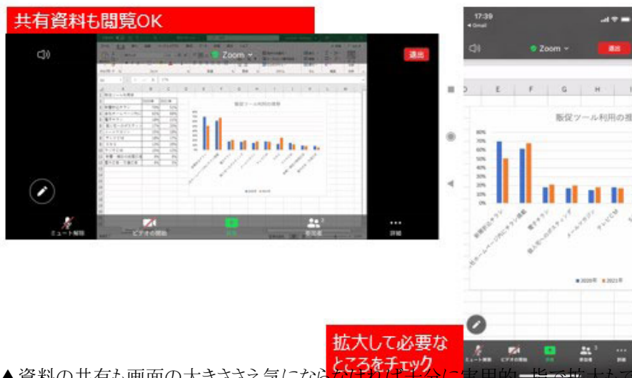
▲資料の共有も画面の大ききさえ気にならなければ十分に実用的。指で拡大もできるので、視認性は確保できる

相談者さんが気にしていた、共有資料の表示はどうでしょう。ホスト側から共有された資料を表示してみました。横向きの画面表示にすればパソコンと同様に閲覧できました。縦位置の画面表示で横長の資料を共有すると、文字が小さくなってしまいます。でもそこはスマホですから、二本指で広げるように操作すれば簡単に拡大できます。お使いのスマホの画面のサイズにもよりますが、よほど小さな文字などの資料の共有でなければ、スマホでも十分に内容を確認できそうです。自分から画面や資料を共有することも可能です。DropboxやGoogleドライブ、OneDriveといったストレージの共有にも対応しています。