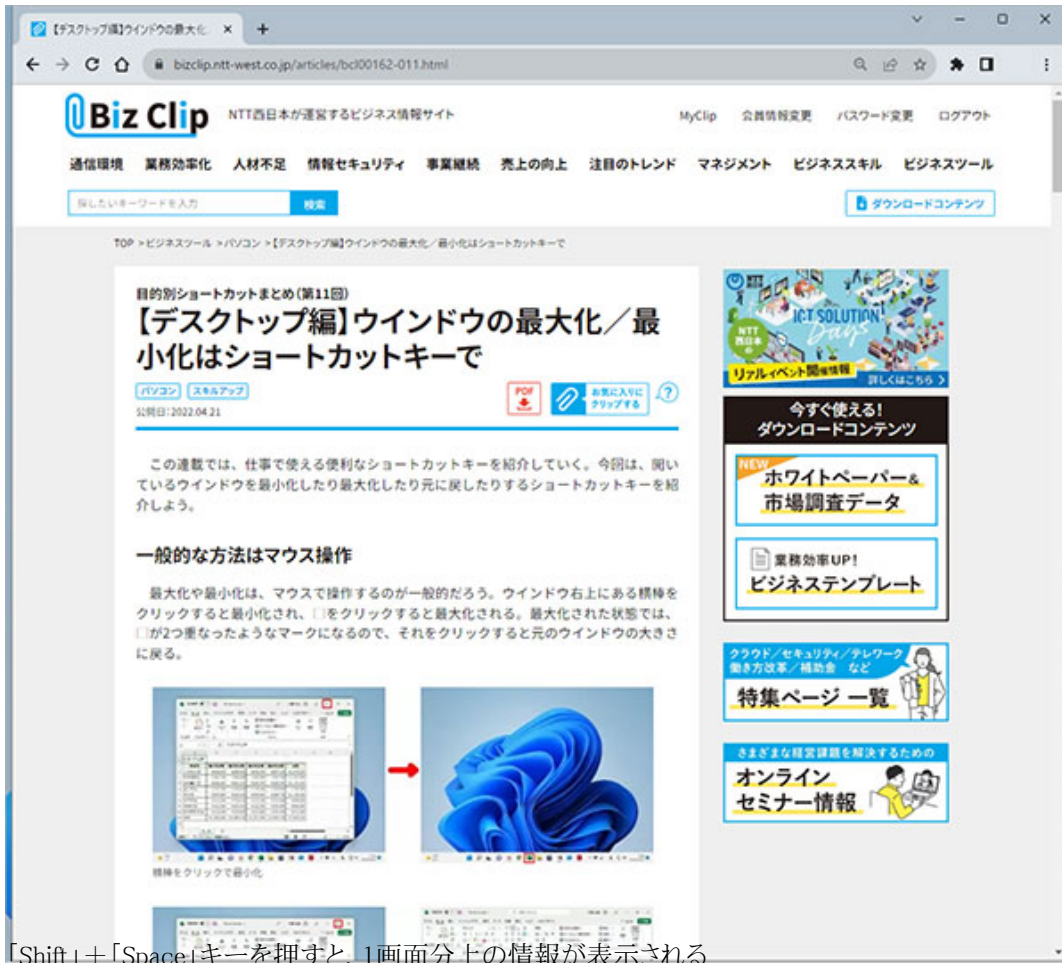
「Shift」+「Space」キーを押すと、1画面分上の情報が表示される

読み進めていくなかで、前の情報を再度見たいときがある。そんなときは先ほどのショートカットキーに「Shift」を加えればよい。「Shift」キーをプラスすることで、逆の動きをすることが多いので、それを覚えておくとう便利だ。