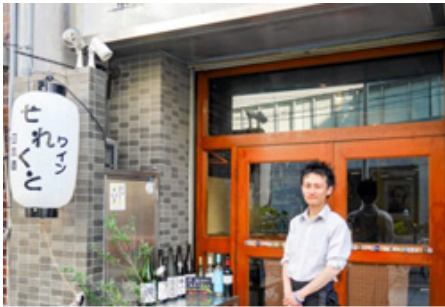
「日本酒とワイン せれくと」の店頭

おひとり様グルメといっても食べるだけではありません。今回のテーマは「ひとり飲み」です。水の都・大阪、土佐堀エリアでこだわりのお酒とアテを提供する「日本酒とワイン せれくと」をご紹介します。