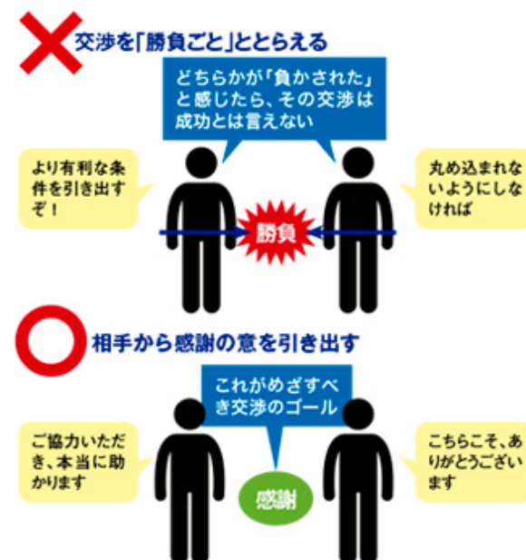
図1 交渉のゴールは「ありがとう」を引き出すこと

交渉と聞くと、「勝ち負け」を争う場面を想定する人が多いでしょう。交渉を勝負ごととして捉えると、「相手にいかに勝つか」「いかに自分に有利な結果に導くか」などをつい考えてしまいがちです(図1)。しかし、プロジェクトの現場においてリーダーが直面する交渉には、一方的な勝ち負けは存在しません。というよりも、勝ち負けがあってはならないのです。